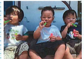
しゃぼん玉あそび