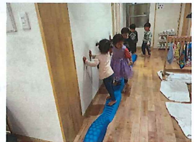
おおきいちゅうりっぷぐみ みんなバランスといながら歩いています♪