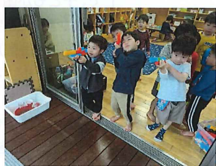
お友だちを見て、真似して、 教えてもらいながら遊んでいます。