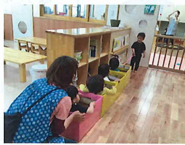
ちいさいちゅうりっぷぐみ 電車、出発しま〜す♪