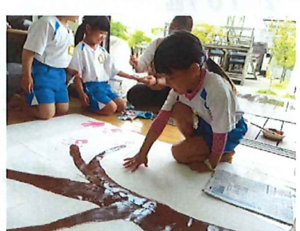
手形スタンプで 桜の木を作りました♪

今月の保育料の引き落とし日は5月27日(月)です。前日までに、ご確認をお願いします。