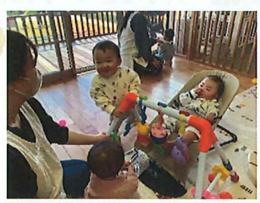
たんぽぽぐみ ゆったり、かかわりを楽しんでいます。