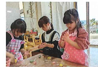
柳もち作り 一生懸命に丸めてるね♪