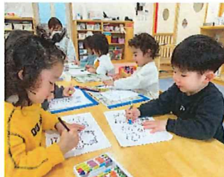
何色にしようかな～