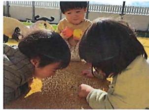
てんとう虫見～つけた♪