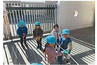
初めての 誘導ロープでのお散歩! 以上児