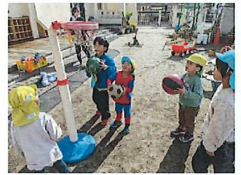
誰が1番にいれるか競争!!