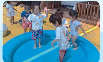
☆大きいちゅうりっぷ組は水遊びがとっても大好き☆