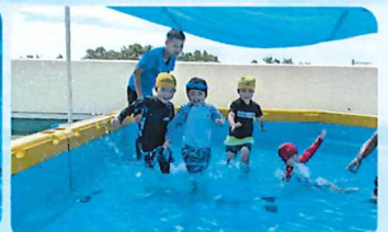
☆さくら組、もも組プール遊び！夢中になって遊んでいます☆