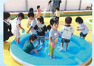
☆たんぽぽ組、小さいちゅうりっぷ組水遊び気持ちいいね☆