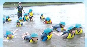
☆ひまわり組はリバーパル干潟体験に行ってきましたよ☆