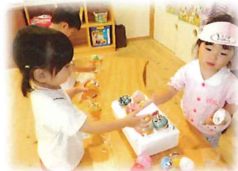
アイスはいかがですか?