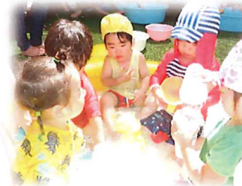
みんなで遊ぶと楽しいね!