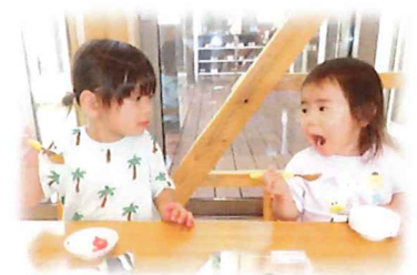
スイカおいしいね!