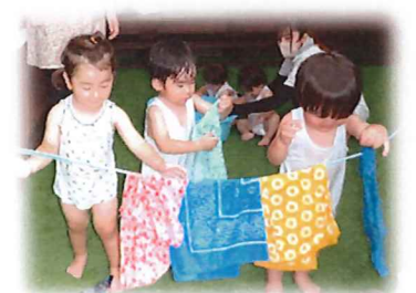
洗濯物を干したよ!