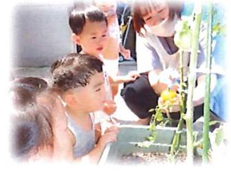
みんなで植えたトマトが育って収穫できました！