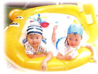
全身で水を楽しむばんび組さん