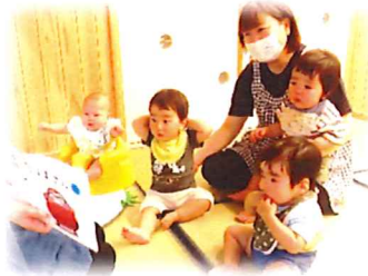
絵本を見るのが上手になってきたひよこ組さん