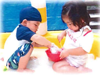
時々しーん…となるくらい夢中になって遊んでいます