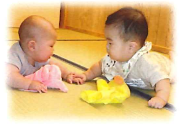
自分で動けるようになってきてよく寄り添って遊んでいます