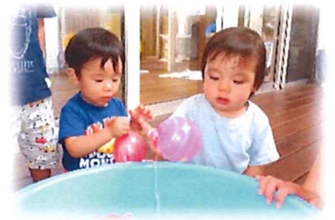
夏祭りのヨーヨー釣り！とっても嬉しそうでした