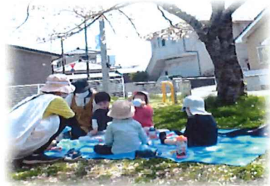
お花見会のお弁当 美味しかったね🍱