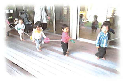
誘導ロープを持っての お外デビューが楽しみだね