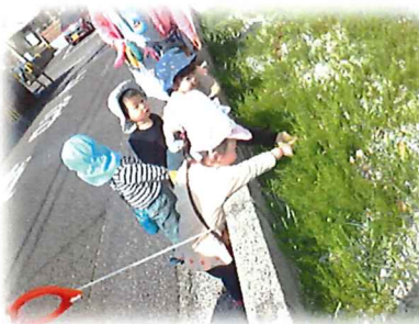
お散歩中に つくしを発見したよ