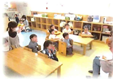
大好きな手遊びや絵本の 時間です♡集中しています。