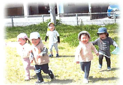
桜の木の下で元気に 「よーいドン！」