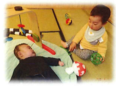
自分より小さいお友だちにも 興味津々です☆