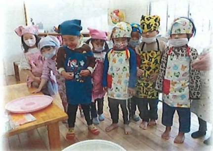
柳もちをつくったよ！