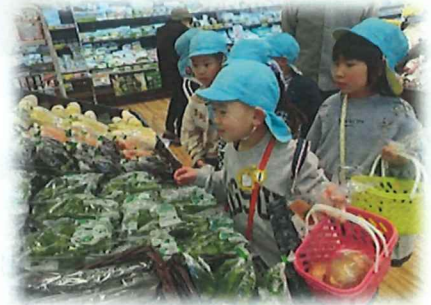
どのお野菜にしようかな♡

今月の保育料の引き落としは 3月25日(水) です。前日までの確認をお願いします。