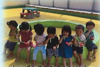
しゃぼん玉遊び楽しいね♪