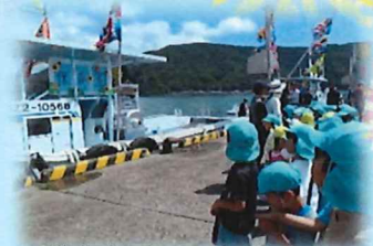
進水式に行ってきました！