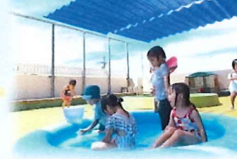
プールあそびで笑顔いっぱい♪