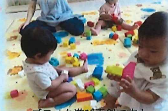
ブロック遊び真剣です！