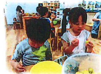
ひまわり組、梅のヘタ取り 美味しい梅干しにな〜れ♡