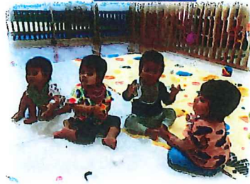
リズムに合わせて楽器あそび