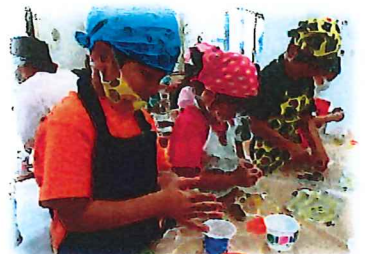
よもぎクッキング楽しいな〜