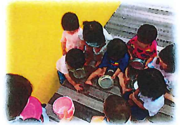
水が冷たくて気持ちいいね