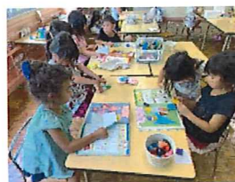
おりがみ楽しいね!