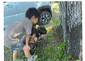
この穴はなんだろう??