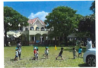
広い園庭で元気いっぱい!!