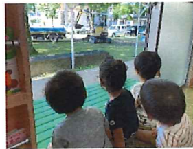
工事のショベルカーに夢中!