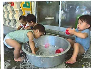
水あそび! 気持ちいいね!