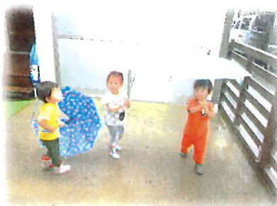
傘と長靴嬉しいね～☆