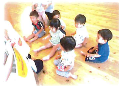
大型絵本に興味津々！