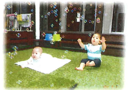
しゃぼん玉ってきれいだね♡