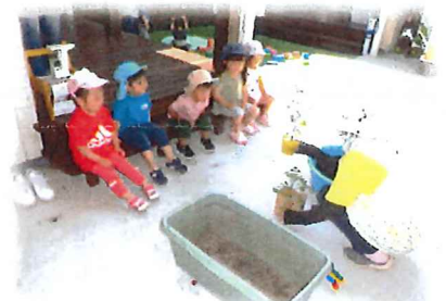
トマト美味しく育つかな？