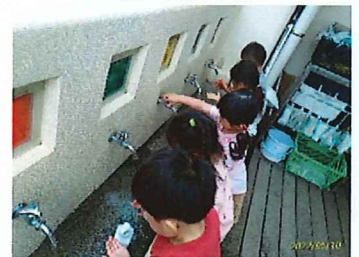
上手に手が洗えるかな？