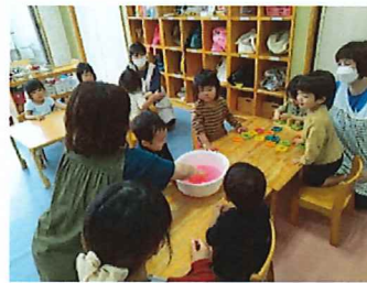
スライムあそびをしたよ！