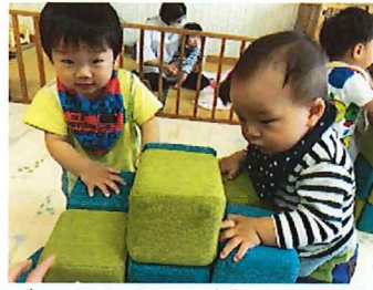
ブロックあそび楽しいな◎