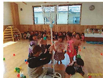
玉入れあそびたのしかったね♡