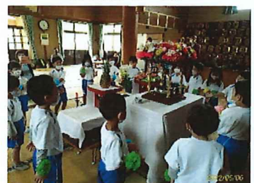
花まつりに参加したよ！