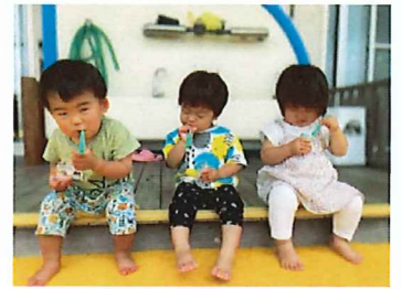
しゃぼん玉楽しいね♪