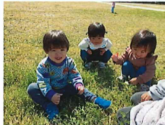
沢山お散歩したね♪