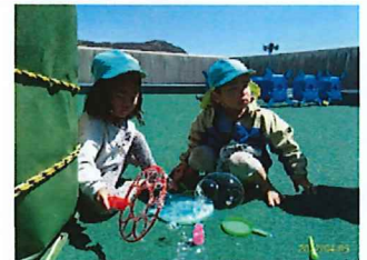
シャボン玉楽しいね★