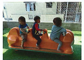
第二園舎楽しいね♡