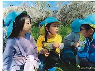
よもぎ摘みに行ったよ♪