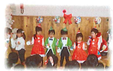
クリスマス会楽しかったね☆