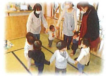
上手に円を作れるように なったひよこさん☆