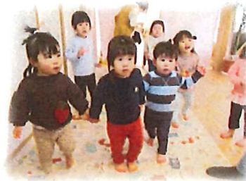
異年齢で遊ぶ姿が増えてきました♡ひよこさんのお世話をしてくれますよ♡