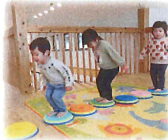
音符マットを並べて jump♪jump♪