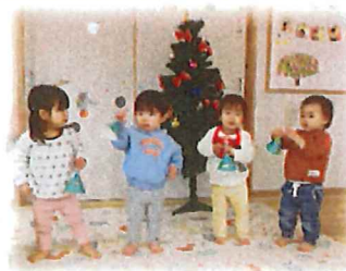
手作りの鈴で演奏会をしたよ♪