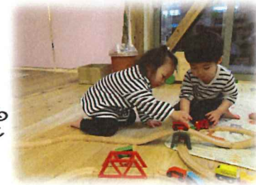
「お友だちと一緒に」が 上手になってきています。