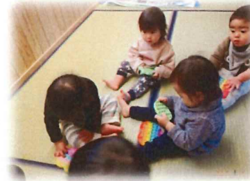
プッシュポップに ひよこさんも夢中