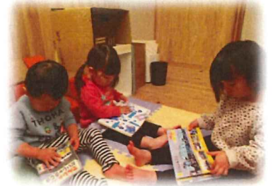
自分で絵本を上手に 見ることができています。