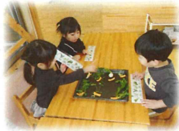
食育では七草について たくさんの発見がありました！