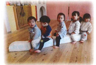
ひよこさん電車が しゅっぱ〜つ！！

感染症が気になる時期ですね。 園では手洗いの歌を歌いながら楽しく 食事の前の手洗いや感染予防対策を 行っています。 ご家庭でもお子さんと歌いながら 手洗いマスターになりましょう♪