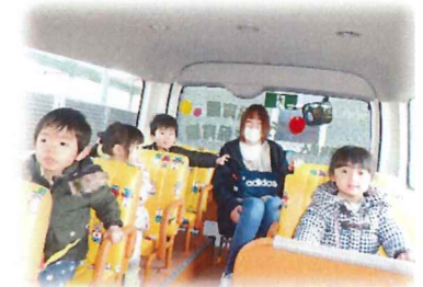
風船バスに乗って ほうざい保育園へ♪