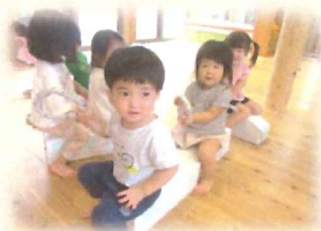
電車ごっこ楽しいな♪