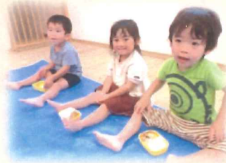
ピクニックランチ！ 2階でお弁当食べたよ♪

しろくまちゃんがホットケーキを作ります。焼き上がったならしろくまちゃんを呼んで、2人で「おいしいね」。見開きいっぱいに描かれたホットケーキの焼ける場面は子どもたちに大人気です。