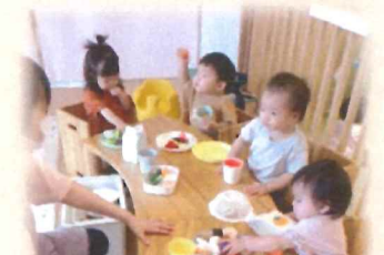
座って上手に おままごとができるよ☆