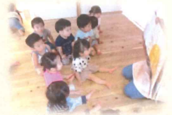
みんな、はらぺこ あおむしが大好き♡