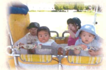
お散歩気持ちいい～！