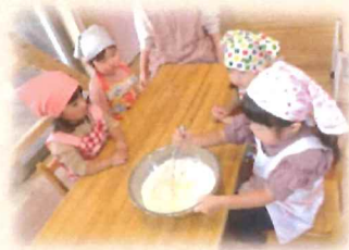
食育活動で絵本に 出てくるホットケーキを 作ったよ！ 美味しかった～♡