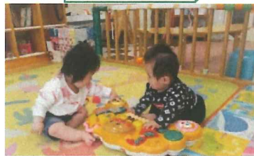
ボタンを押していい音色♪