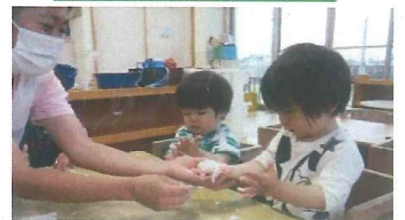
小麦粉粘土、上手でしょ♪