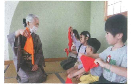
おてまえ。真剣そのものです。