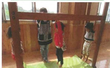
「みてみて！すごいでしょ！」