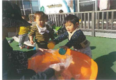
お片付け上手でしょ!!