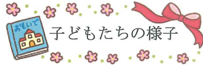
子どもたちの様子