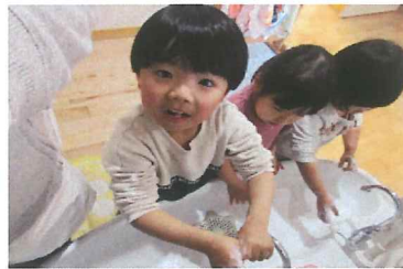
手洗い・うがいでばい菌バイバイ!