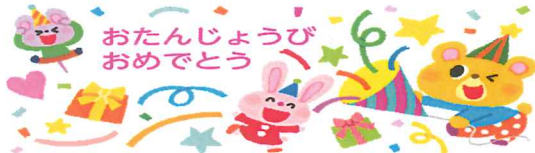
おたんじょうび おめでとう