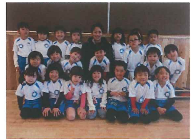
太陽スポーツ! ありがとう♪