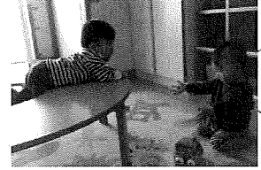
ほら見て〜☆ 凄いでしょ？