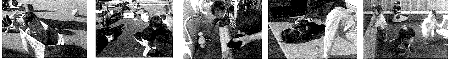
テラスあそびポカポカ陽気で気持ちがいいよー。好きな車に乗ってドライブー。