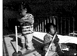
このおもちゃで あそびたいよー