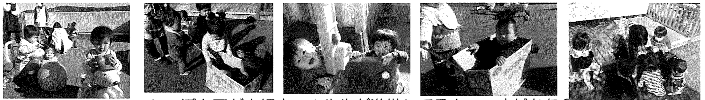
しゃぼん玉が大好き〜☆先生が準備してるよー。まだかな？