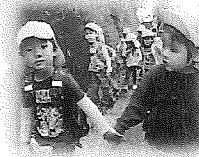
いっしょにがんばろうね

愛宕山の頂上を目指し、励まし合ったり、諦めかけたりながらも、無事に登りきった子どもたちです！またひとつ成長しましたね♡