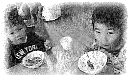
じぶんでつくとおいし～