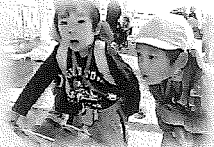
あれがしょうぼうしじゃない？