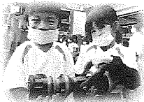
けっこうおもいんだね～