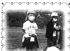
勇気を出して、園児代表で感想を発表してくれました！