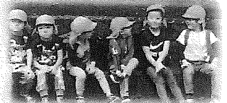
きゅけいってだいじだよね～