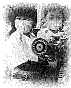
かっこいいでしょ？

ひので保育園の年長さんと消防署見学へ。学ぶ姿勢がキラキラ輝いていました！帰りは一緒に歩き、給食も食べて、お友だちができました。