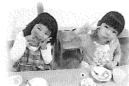
すぷーんがとまらない♡

今月はまっくろくろすけ作り(芋トリュフ)やパンケーキデコレーションを楽しみました♪