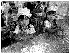
どんな形にしようかな♪