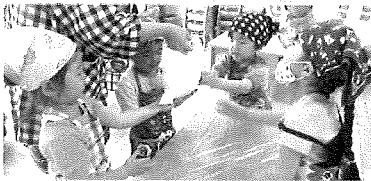
小麦粉ってふわふわ～

みんなで摘んだよもぎが大変身！ 実際に見て、触れて、味わって、楽しい食育になりました。