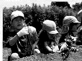
どうやって植えるの？！

今年是一人一株ずつでし たが、大事に丁寧に植 えることができました。10月 の芋ほりが楽しみです♪