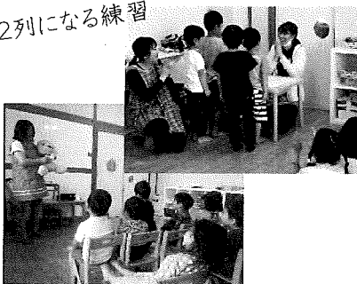
拭き方も習ったよ

今月は『色んな順番』と『トイ レ名人』のお話がありました。 あそびや生活にある大切な ものを毎月ハートスキルの時 間に一緒に考えています。 心の成長が見られるとすごく うれしいですね♡