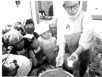
魔法の水って牛乳～？！