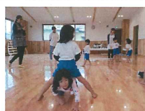
以上児：太陽スポーツで沢山身体を動かしているよ。