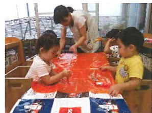
ハロウィンの衣装製作中。いろいろな色のペンを使ってお絵描き。

保育料納入日は、 11月25日(水) となっています。前日までにご確認をお願いします。