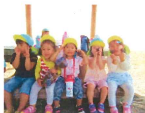
大きいちゅうりっぷ：みんなで松ぼっくりやどんぐり見つけたよ。