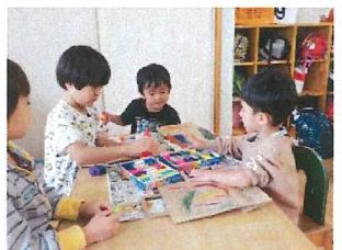
ハロウィンのお土産袋を自分たちで作っているよ。