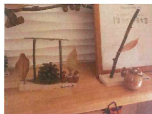
秋の製作活動～どんぐり等を取りに行って、作ったよ。