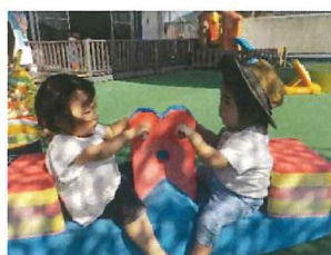
たんぼぼ：仲良く二人でぎっこんぱったん