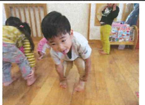
動物体操～全身を使って音楽に合わせて動くよ