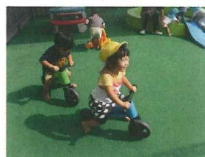
小さいちゅうりっぷ：バイク大好き。友だちと乗るのが楽しいよ