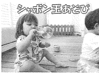
シャボン玉あそび