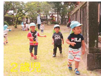
2歳児 神社へお散歩に行きました。