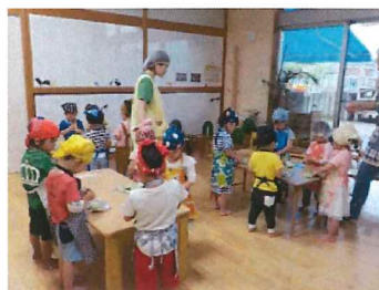
手作りクッキングでヨモギクッキー作りをしました。