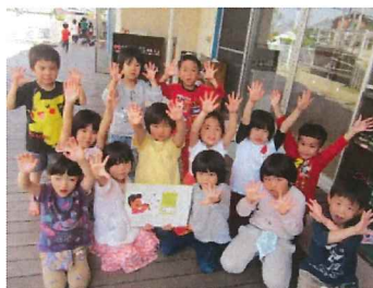
ハートスキルで手洗いの お勉強をしました。