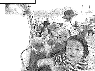
お手てを綺麗に洗ったよ