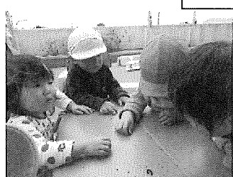
ダンゴムシを触れるよ