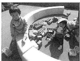
暖かくて気持ちいいな