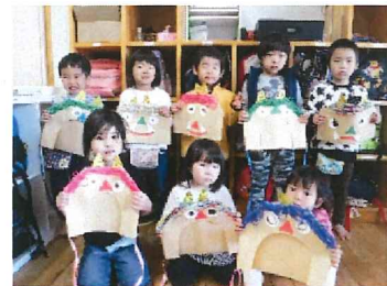
鬼のお面を作りました (さくら組)