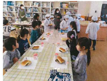
方財小で給食を食べました (ひまわり組)