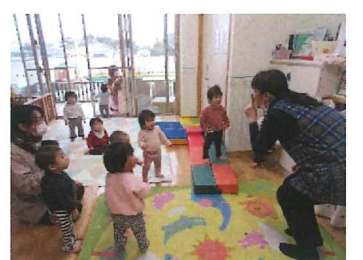
リズムあそびをしています (たんぼぼ組)