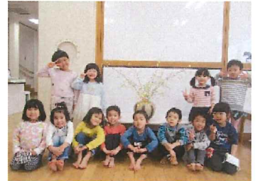
柳餅を作りました (もも組)