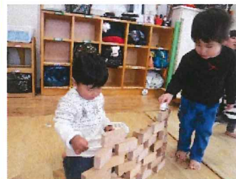
童具あそびに夢中 (小ちゅうりっぷ組)

のねずみたちに頼まれて森にでかけたお雛さまは、雪が降り始め、家に戻ったお雛さまたちはすっかり汚れてしまいます。さあ、大変！ 続きは絵本でお楽しみ下さい。