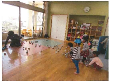
鬼は外～福は内～ (大ちゅうりっぷ組)