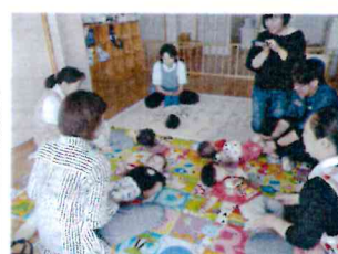
保育参観日(乳児) 気持ちよさそう♡