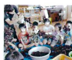
梅干作り! 美味しく出来あがりますように♪