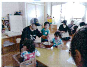
保育参観日(1歳児) すり鉢でふりかけ作り!