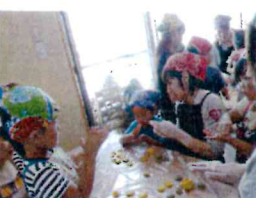
保育参観日(以上児) 野菜クッキー作り♪