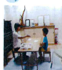
以上児 お箸検定試験中!