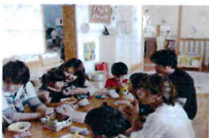
保育参観日(2歳児) おいしいふりかけの完成!