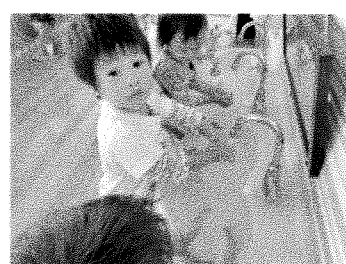
あそんだ後は手洗い。「バイ菌さんバイバ～イ！」