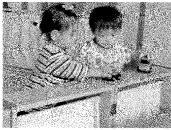
車が通ります！安全運転で、おねがいします♪