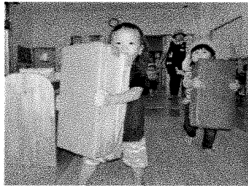
遊んだあとは倉庫まで運ぶお手伝いをしてくれます。