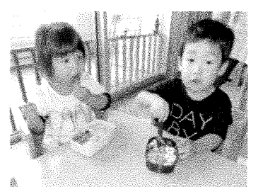
おいしいお弁当を作ってくれてありがとう！