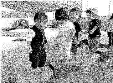
階段マット渡り。落ちないようにゆっくりね♪