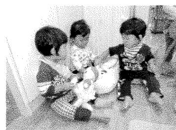
人形にミルクをあげます。いっぱい飲んでね。