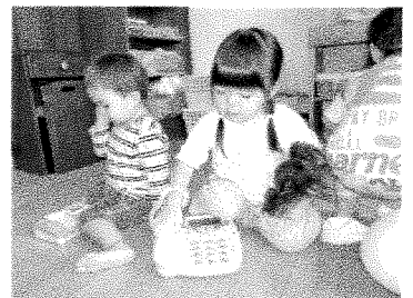
「もしもし～」誰かと電話中です。