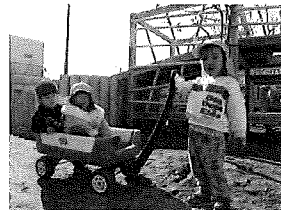
☆乗車のかたはいませんかー?