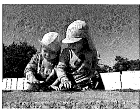
☆砂で何を作っているのかな??