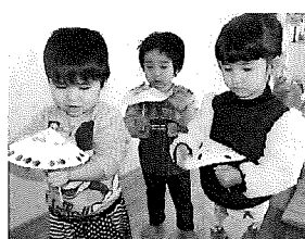
☆回しコマをクルクル~きれいに回ったね!!