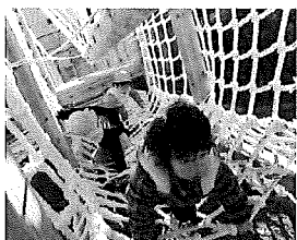
☆園庭の遊具楽しいな――。