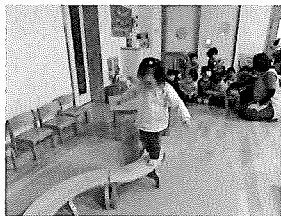
☆平均台上手に渡れるかな??

昼食後の着替えがとても上手になっている、いちごグループさん。袖を自分で持って、できるところまでやってみようとする事が多くなりました。お絵描きやパズルが大好きで、自由時間には自分の好きな玩具で時間いっぱいあそんでいます!お友だちとのかかわりが増え、困っていると近づいて声をかける姿も見られるようになりました。