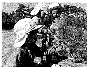
☆ここにもあったよー!!実たくさん集めたね!!