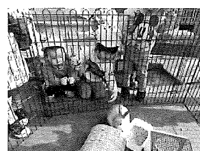
☆ほうざい保育園の新しい友だちのウサギさん!!餌たくさん食べてね