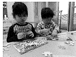
☆パズルにはまっています!!!