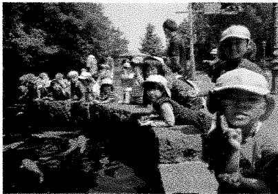
こいのぼりウォークラリー

6月に入ると雨も多くなりますが、先日作った雨がっぱを「いつ着てお散歩に行けるかなー」と楽しみにしているほしグループさんです。梅雨ならではの遊びをたくさん取り入れ、楽しみたいと思います。