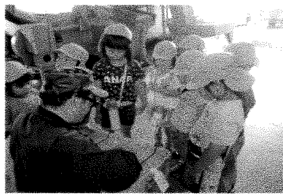
ちりめん工場見学(ひまわり)