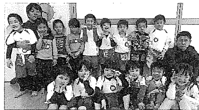
お別れ遠足はうみたまご！ とても楽しかったね♪