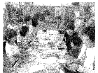
地域との七夕交流