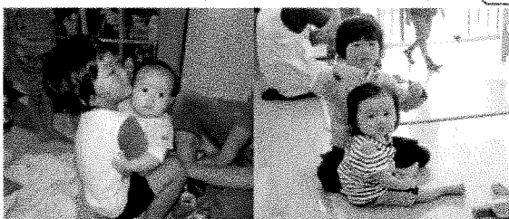
小さなおともだちも仲間入り