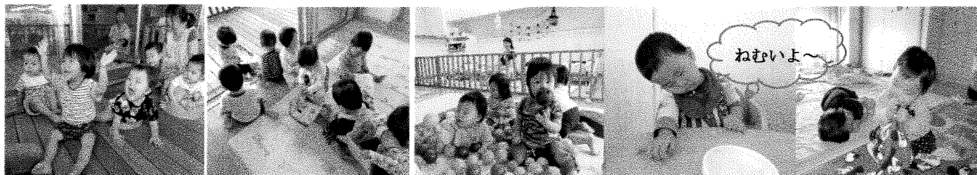
手遊び、絵本がみんな大好き！

肌に触れる風もだんだんと冷たくなり、晩秋の気配が感じられるようになりました。昼夜の寒暖の差が大きくなってきましたね。体調管理に十分気をつけて過ごさせてあげたいと思います。今月行われた「なかよしワイワイデー」ではご参加ご協力ありがとうございました。保護者の皆様のおかげで思い出に残る一日となりました。