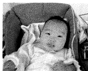
マットの小山で遊んだよ