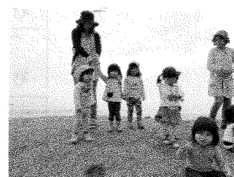
浜までお散歩☆ 芝山の上から「ヤッホー！」