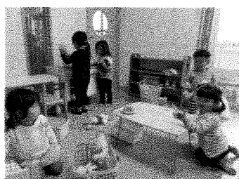
おままごとコーナーで遊んでいます！ 楽しそう☆