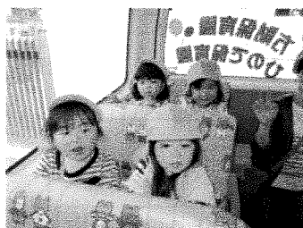
ふうせんバスに乗って、お花見遠足へ出発！ 緑が丘公園をたくさん歩きました☆ 桜の花、とってもきれいだったね！ またみんなで来るといいなあ～♡