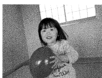
風船遊び大好き！ 3Fのお部屋で大はしゃぎ☆