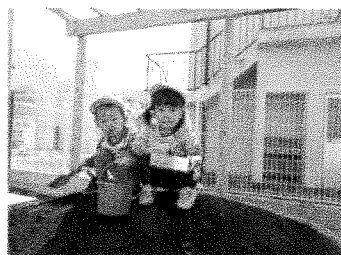
お外遊び☆ 園庭の遊具も増えました！