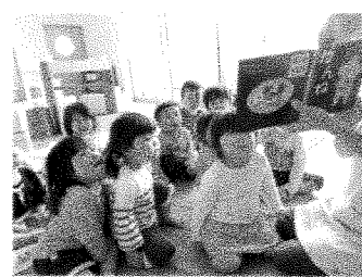
絵本を見る姿も、とってもかわいい子ども達です♡