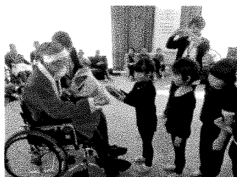
恒富東デイサービス訪問