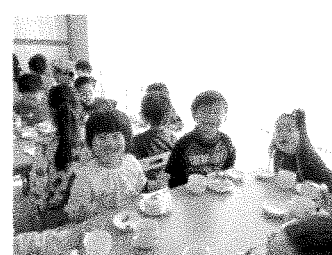
ケーキも食べたね