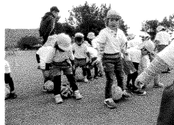
太陽スポーツ（さくら・もも）