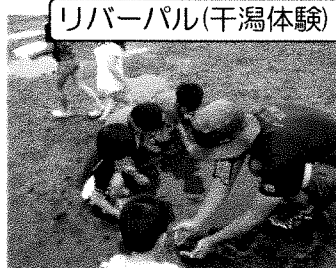
リバーパル(干潟体験)