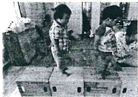
上手に椅子の橋渡れるよ