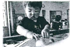
道を繋げて車が走るよお