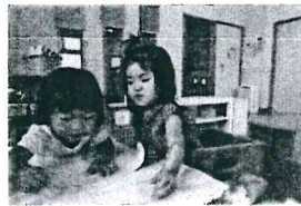
お絵かき大好き♪楽しい