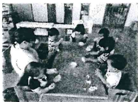
小麦粉ねんどで遊んだよお