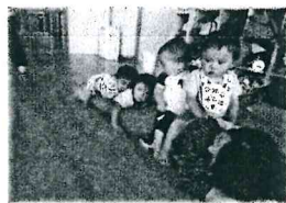
先生ワニさんの背中に乗る