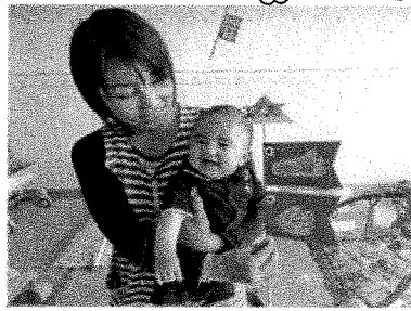
いつも優しいお兄ちゃんお姉ちゃんが大好き♡