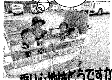
乗り心地はどうですか~?