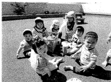
みんなこっち向いて~! おやつタイム!自分で自分で!!