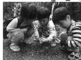
☆どんぐりみーつけた!!

行ってきました!! 残念ながらの雨でしたが、施設を探検したり、昆虫、動物のはく製を興味津々で見たり、講堂で玉入れをしたりとたくさん遊びました☆施設内に沢カニを見つけると大喜びで見ていた子どもたちです!!