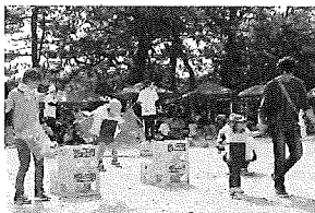
☆親子団技!! 親子で楽しくゴールできたね!!