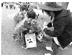
☆お菓子もらってうれしいね♡