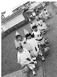
☆かわいいオバケたちが歩いていくまーす☆