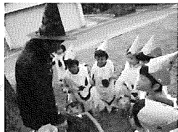
☆「トリックオアトリート」「お菓子をくれないといたずらしちゃうぞー」

手作りの衣装やバックを持って、方財町を回りました。「トリックオアトリート!!!」「おかしをくれないといたずらしちゃうぞー」と言って、お菓子をもらって大喜びの子どもたちでした☆ご家庭でもお話聞いてくださいね。