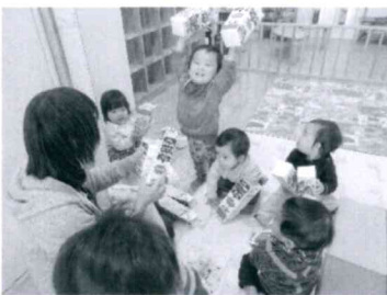
「どんなものでもすぐおもちゃに変身」