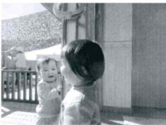
「ガラス越しに笑い合う二人」