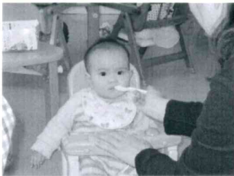
「離乳食おいしくたべています」

今年も残すところわずかとなりました。4月からの色々な行事への参加、日頃のご協力ありがとうございました。低月齢のおともだちは、お座りで遊べるようになってたり、離乳食を食べるようになりました。中月齢のおともだちは、高月齢のおともだちと一緒にテラスに出てあそぶようになりました。高月齢のおともだちは、ともだちと関わって遊ぶ姿が多く見られるようになりました。来年も子ども達と一緒に楽しみたいと思います。よろしくお祈りします。