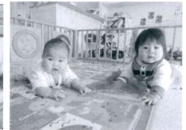
「腹這いで長く遊べるようになりました」