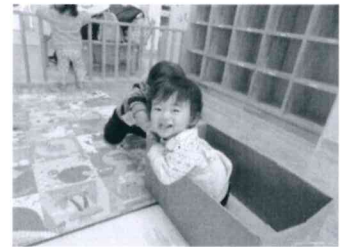
「お友達に押しってもらって大喜び」