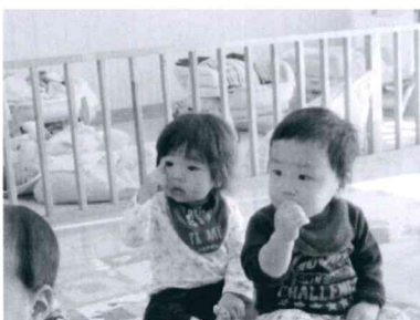
「だるまさんの練習中」