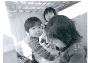
「みんなミニハウスが大好き」