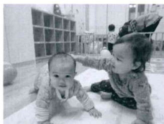
「よよよする姿がかわいいね」