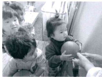
「順番待ちも上手になりました」