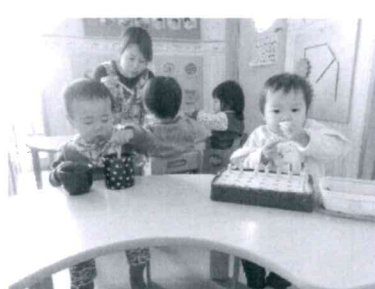
「椅子に座って指先遊びができます」