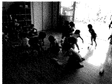
ペットボトルあそび(にじグループ)