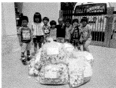
エコ活動(ひまわり組)