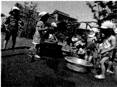
泥んこあそび(ほしグループ)